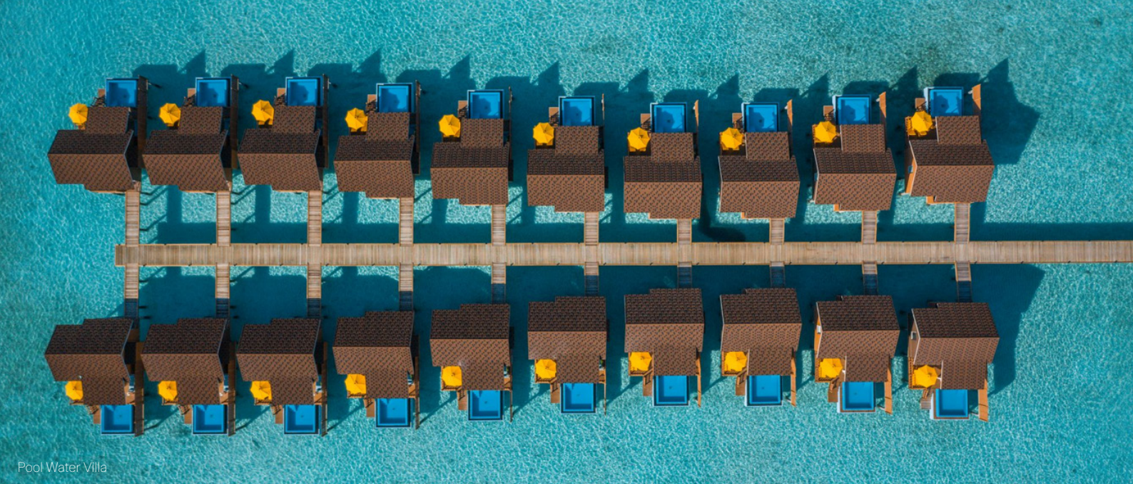
Pool Water Villa