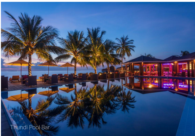
Thundi Pool Bar