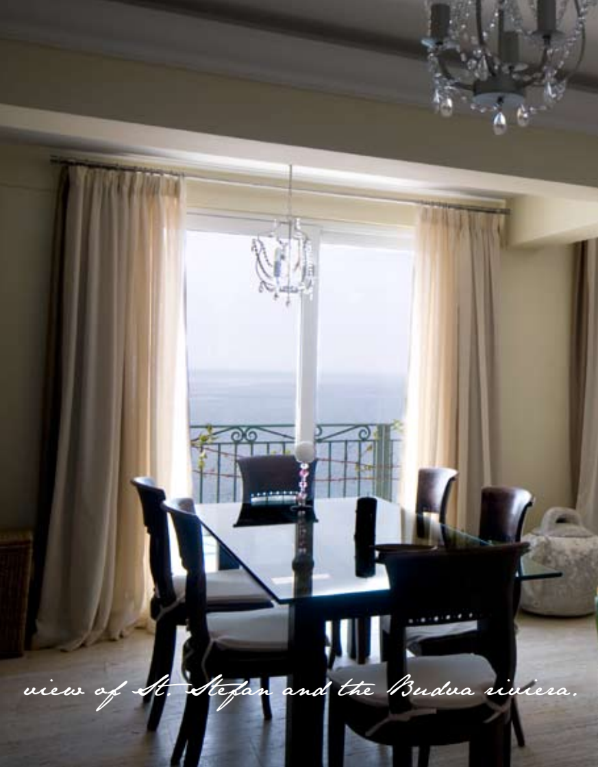
view of St. Stefan and the Budva riviera.